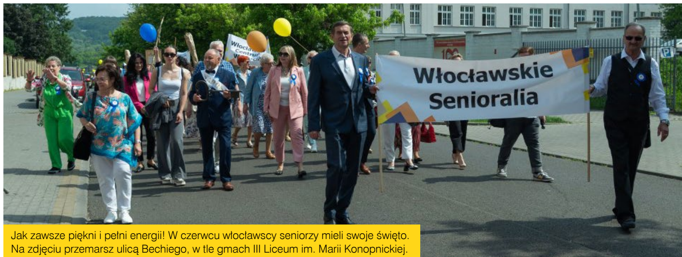
Jak zawsze piękni i pełni energii! W czerwcu włocławscy seniorzy mieli swoje święto. Na zdjęciu przemarsz ulicą Bechiego, w tle gmach III Liceum im. Marii Konopnickiej.