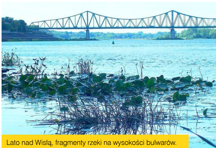
Lato nad Wisłą, fragmenty rzeki na wysokości bulwarów.

Wiosną 2025 uczestników czekają kolejne edukacyjne spotkania, warsztaty i konkurs.